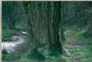
Vallée du Coatoulz'ach