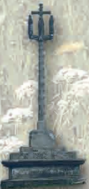
Calvaire de Bougès