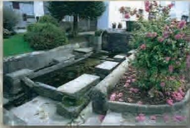
Lavoir et Fontaine du Bourg

Ils ont été rénovés en 1990 par la commune. C'était l'un des lavoirs les plus fréquentés de la commune.