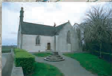
Chapelle Sainte Brigitte

Sa construction remonte au moins au XVI ème siècle. La profonde restauration de 1865 en a fait une chapelle moderne en forme de croix latine.